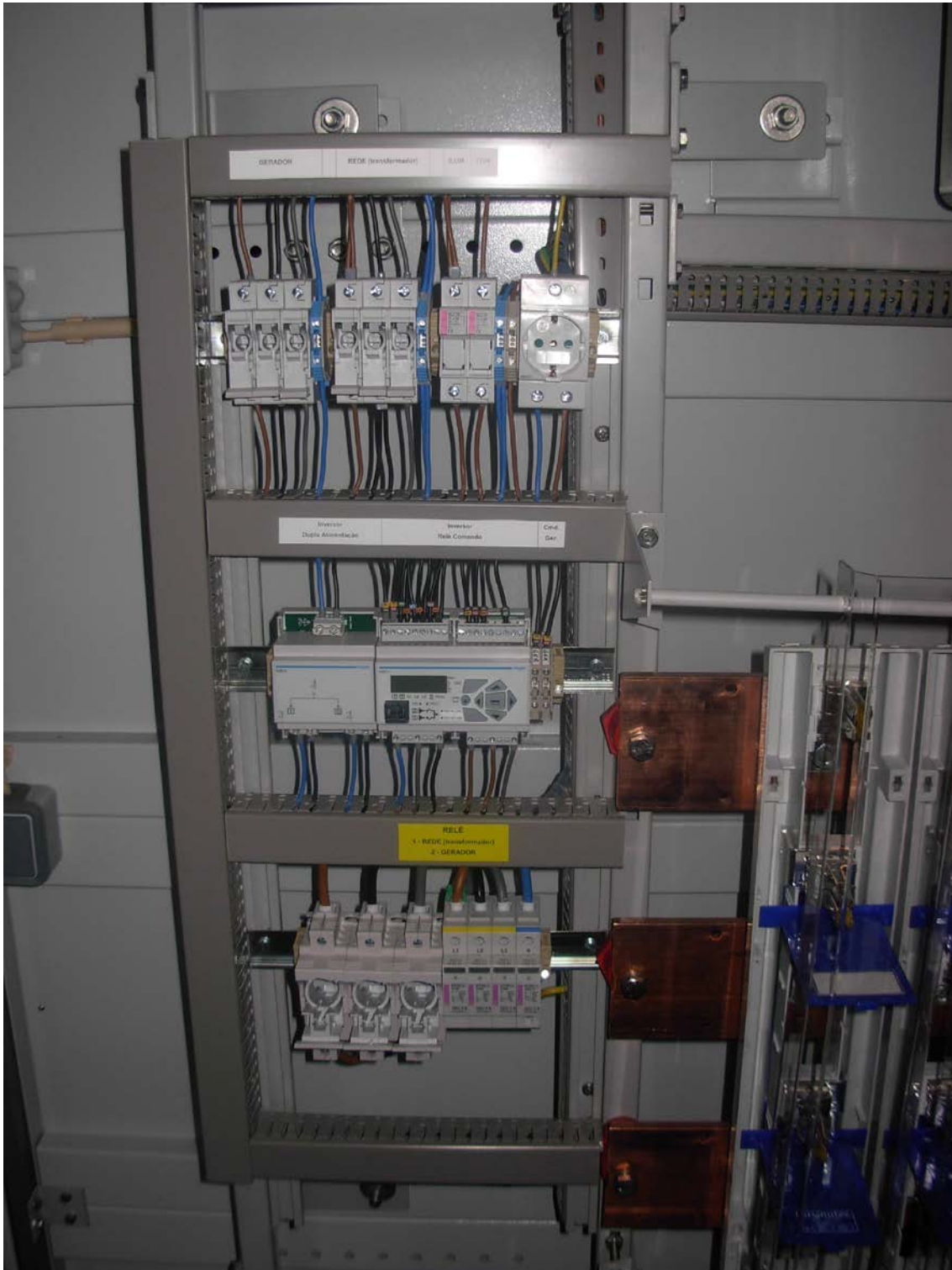
Quadro Aberto com Inversor Automático Rede/Grupo Montado em Posto de transformação monobloco