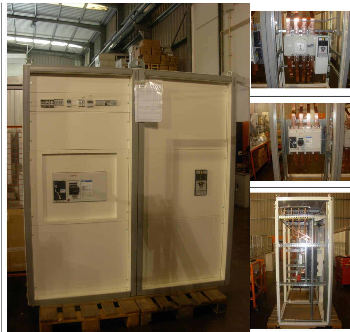
Quadro Inversor Automático Rede/Grupo